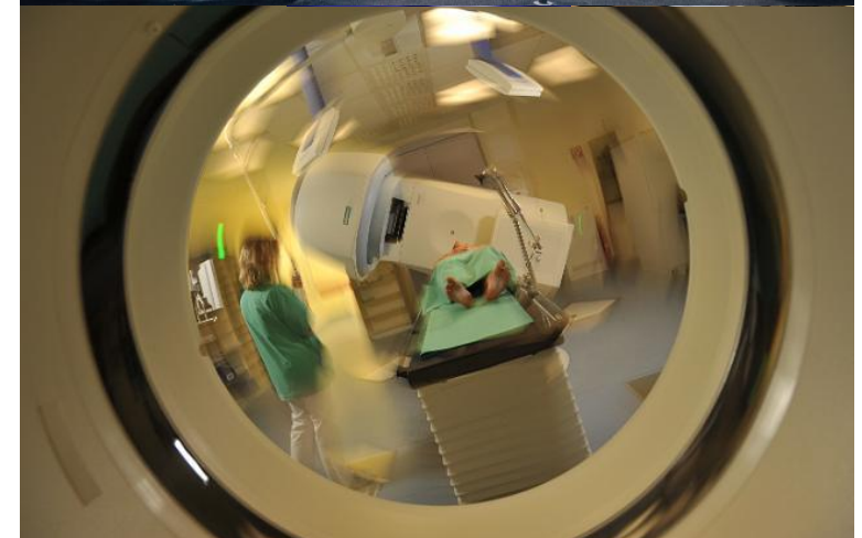
Stand Mai 2014